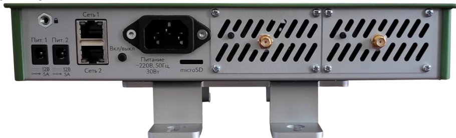
Рисунок 2.1 - Задняя панель Блока

На рисунке 2.2 показана задняя панель Блока с двумя модулями TP-804-DECT.