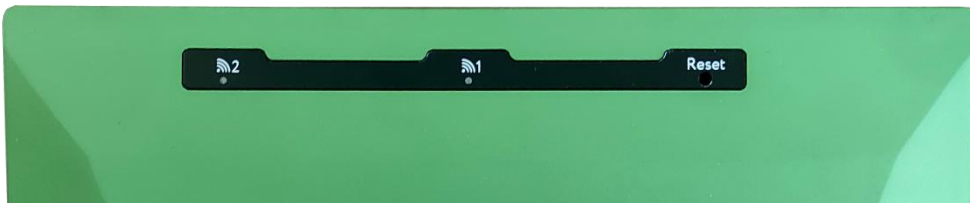
Рисунок 2.3 – Верхняя панель Блока

На верхней панели Блока расположены (слева направо):