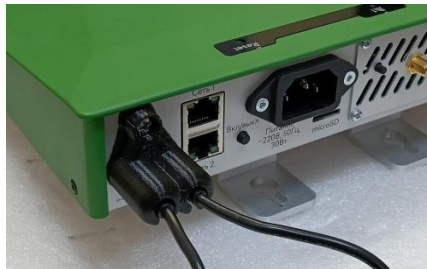
Рисунок 3.1 – Фиксатор кабеля БП