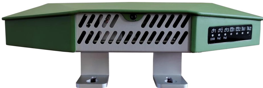
Рисунок 2.2 - Передняя панель Блока

Внешний вид передней панели Блока показан на рисунке 2.3.