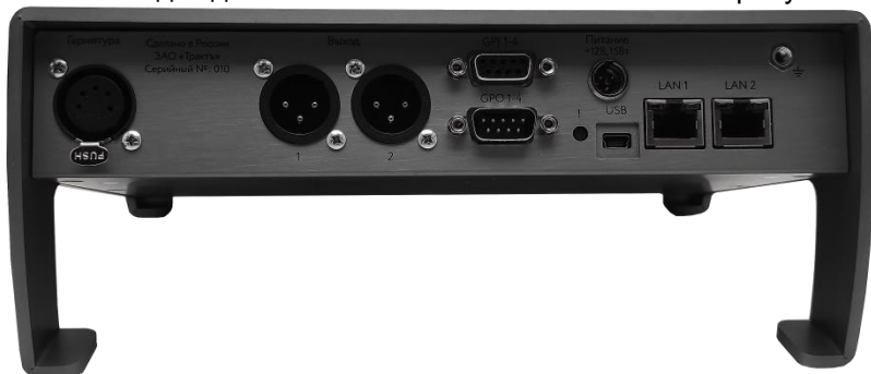
Рисунок 2.2 - Блок TP-816. задняя панель

Внешний вид задней панели блока TP-816 показан на рисунке 2.2.