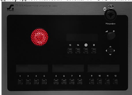
Рисунок 2.1 - Блок TP-816. передняя панель

Внешний вид передней панели блока TP-816 показан на рисунке 2.2.