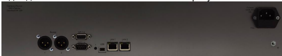
Рисунок 2.3 - Блок TP-840. Задняя панель

На задней панели Блока расположены следующие разъемы (слева направо):