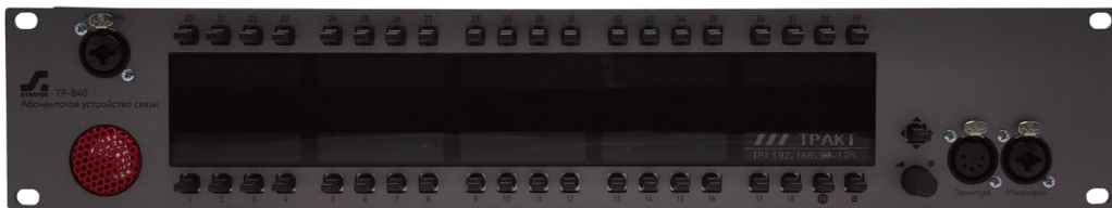
Рисунок 2.2 - Блок TP-840. Передняя панель Внешний вид задней панели блока TP-840 показан на рисунке 2.3.