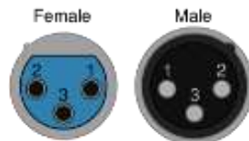
Рисунок 3.2 - Разъёмы XLR F и XLR M