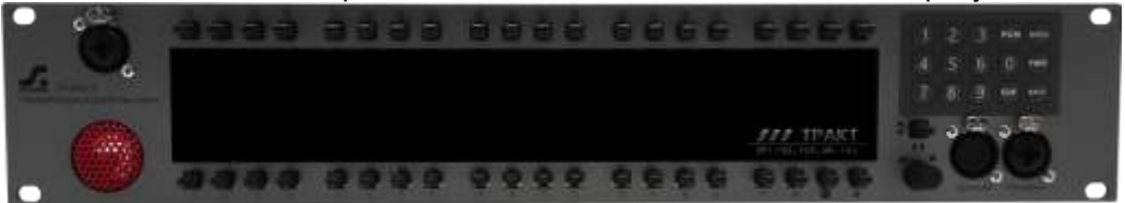
Рисунок 2.2 - Блок TP-840T. Передняя панель

Внешний вид передней панели блока TP-840T показан на рисунке 2.2.