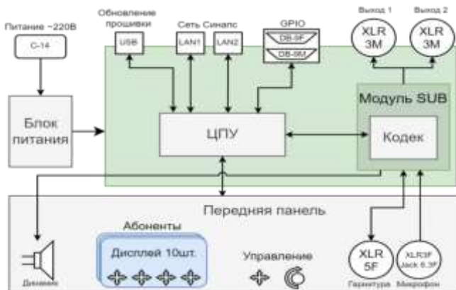
Рисунок 2.1 - Блок ТР-840Т. Структурная схема

Структурная схема блока ТР-840Т приведена на рисунке 2.1.