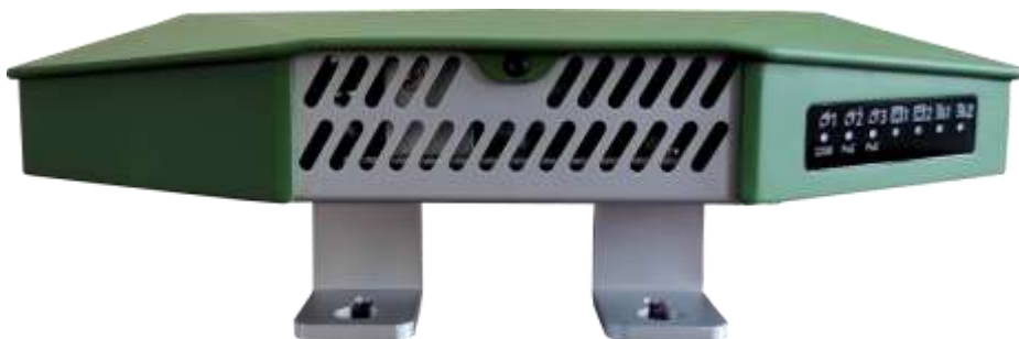
Рисунок 2.2 - Передняя панель Блока

Внешний вид передней панели Блока показан на рисунке 2.3.