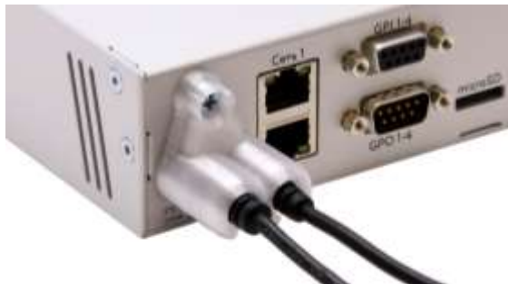
Рисунок 3.1 – Фиксатор кабеля БП