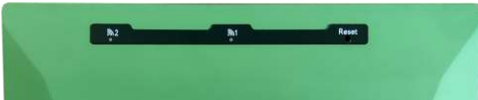
Рисунок 2.3 – Верхняя панель Блока

На верхней панели Блока расположены (слева направо):