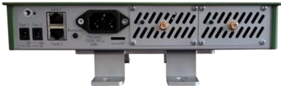
Рисунок 2.1 - Задняя панель Блока

На задней панели Блока расположены (слева направо):