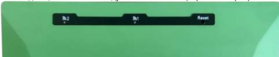
Рисунок 2.3 – Верхняя панель Блока

На верхней панели Блока расположены (слева направо):