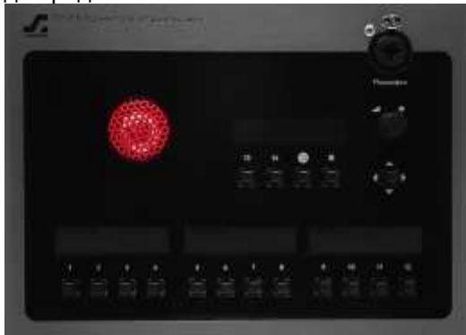
Рисунок 2.1 - Блок TP-816. передняя панель

Внешний вид передней панели блока TP-816 показан на рисунке 2.2.