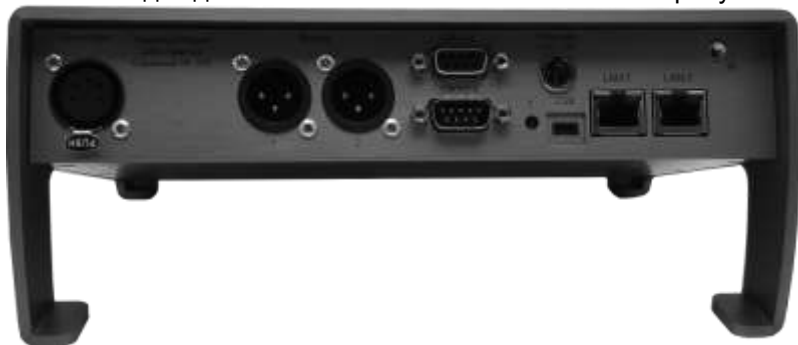
Рисунок 2.2 - Блок TP-816. задняя панель

Внешний вид задней панели блока TP-816 показан на рисунке 2.2.