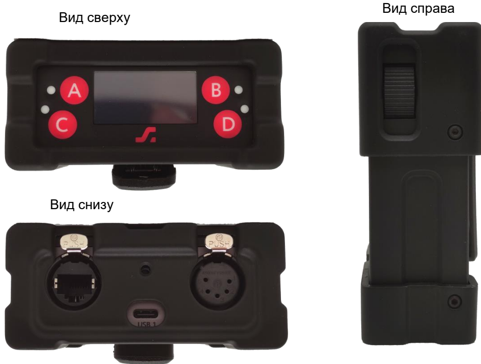
Рисунок 2.3 - Боковые грани Белтпака

Внешний вид боковых граней Белтпака показан на рисунке 2.4.