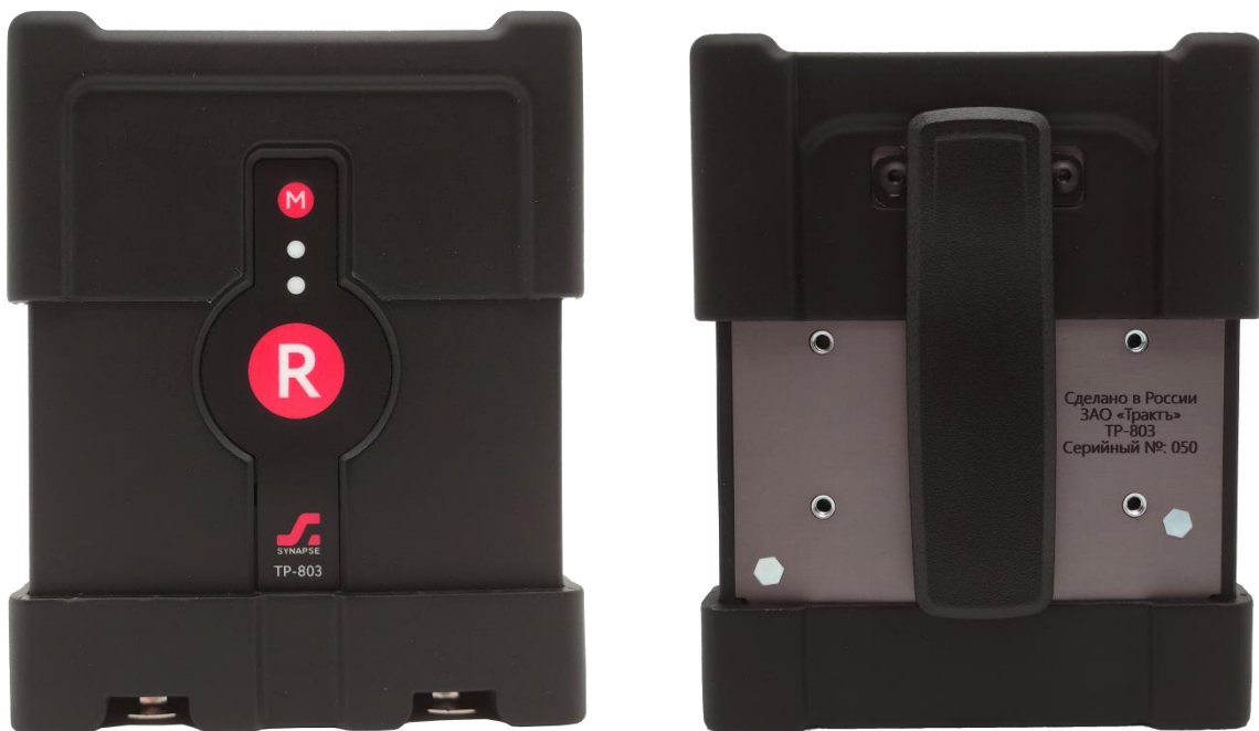
Рисунок 2.2 - Передняя и задняя панели TP-803

Внешний вид Белтпака показан на рисунке 2.3.