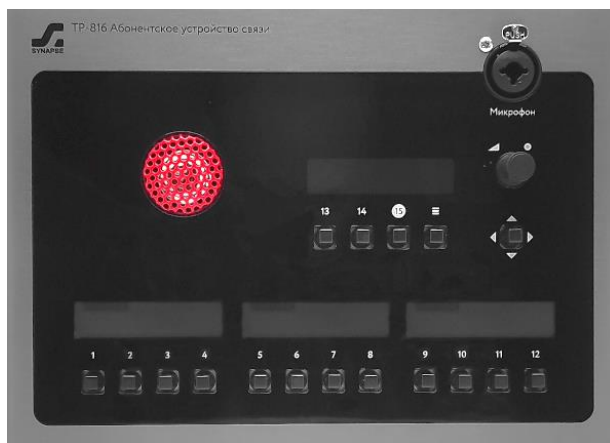
Рисунок 2.1 – Блок TP-816. Передняя панель

Конструктивно Блок выполнен в металлическом корпусе для установки на стол. Внешний вид верхней панели TP-816 показан на рисунке 2.1.