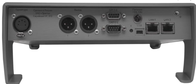
Рисунок 2.2 – Блок TP-816. Задняя панель

Внешний вид задней панели блока TP-816 показан на рисунке 2.2.