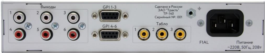
Рисунок 4.1 - Вид на блок TP-140 со стороны задней панели

Блок имеет шесть управляющих входов типа «сухой контакт», подключаемые к устройствам с помощью двух разъемов DB9F («GPI 1-3» и «GPI 4-6») на задней панели (рис. 4.1)