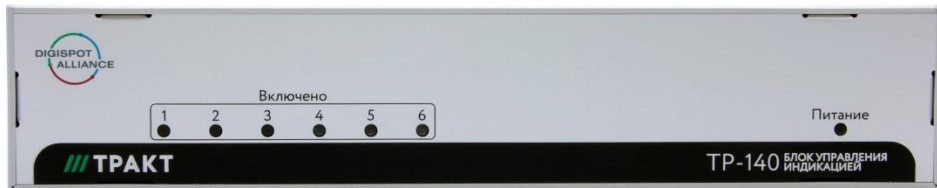
Рисунок 4.2 - Вид на блок со стороны передней панели

Назначение контактов разъемов входных сигналов приведено в таблице 4.1. Полярность выходных разъемов показана на рисунке 4.3