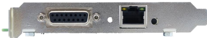
Рисунок 2.3 - Вид со стороны задней панели

Внешний вид со стороны передней панели показан на рисунке 2.3