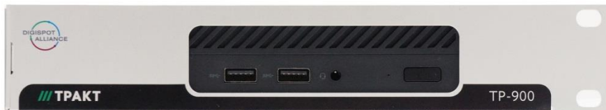
Рисунок 2.2 - Вид Блока со стороны передней панели

Внешний вид Блока показан на рисунках 2.2 и 2.3.