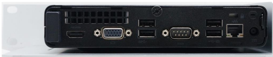
Рисунок 2.3 - Вид Блока со задней панели