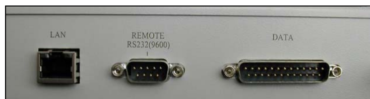
Рис. 1. Разъем DATA

Сервис RDS используется при формировании потока данных для последовательного вывода на RDS-кодер FORA-600 (Fora FirmWare «May 7 2008 18:42:34» и более позднее). Стоит отметить, что полная поддержка RDS-сервиса реализована во всех кодерах, купленных у ООО «Растон» после 1 января 2009. Новые кодеры имеют маркировку Fora 600k и оборудованы 25 pin (male) разъемом «DATA» для программирования (см. рис. 1). Для обеспечения совместимости с более ранними версиями аппаратного обеспечения, приобретенного в ООО «Растон», необходимо обновить прошивку. Сделать это можно бесплатно либо в лаборатории «Растон» (при этом оплачивается только доставка кодера в оба конца), либо собственными силами. В последнем случае необходимо связаться с ООО «Растон» для получения обновленного firmware. Кодеры производства компании Vigintos (Литва), маркированные как Fora 600, необходимо перепрошивать только в лаборатории «Растон». Для этого оборудования обязательной является предварительная модернизация, таким образом, услуга – платная. Контакты ООО «Растон» вы можете найти в разделе «Контактная информация».