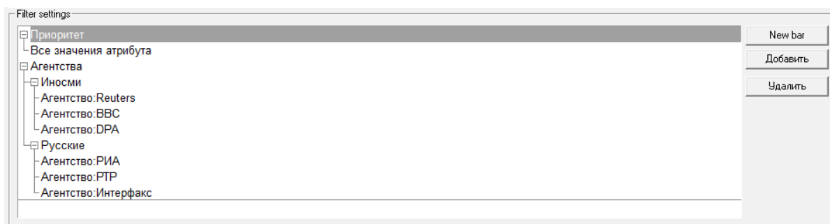
Рис. 2. Пример настройки фильтров

На рис. 2 приведен пример настройки фильтров. Согласно изображенному дереву, в системе присутствуют 2 фильтра: простой, для значений атрибута Приоритет , и сложный, который называется Агентства . Для фильтра Агентства созданы 2 ярлычка: Иноски и Русские . Во время использования данного фильтра при выделении ярлычка Русские в ленте окажутся только сообщения, полученные от любого из трех агентств: РИА, РТР, Интерфакс. Аналогично, ярлычок Иноски покажет только сообщения от трех иностранных агентств: Reuters, BBC, DPA.