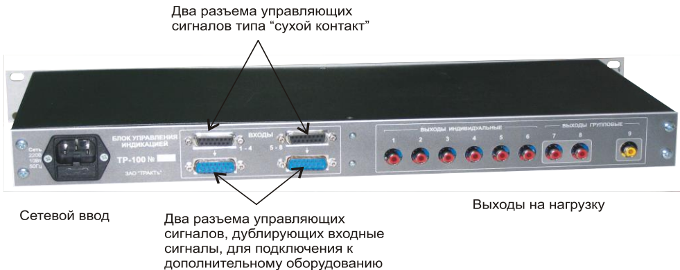
Рис.2. Вид на блок TP-100 со стороны задней панели, выпускаемый до 2010 года