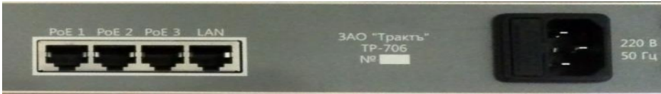
Рис.3. Вид на блок TP-706 со стороны подключения разъемов.

На тыльной стороне расположены разъем для подключения кабеля питания 220В, разъемы PoE для подключения до 3-х устройств TP-705, разъем LAN для подключения к локальной сети.